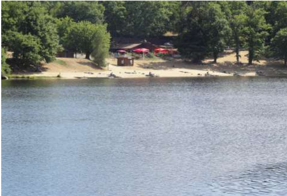
SECTEUR JOUILLAT (SECTEUR DE SECOURS. 10 places)