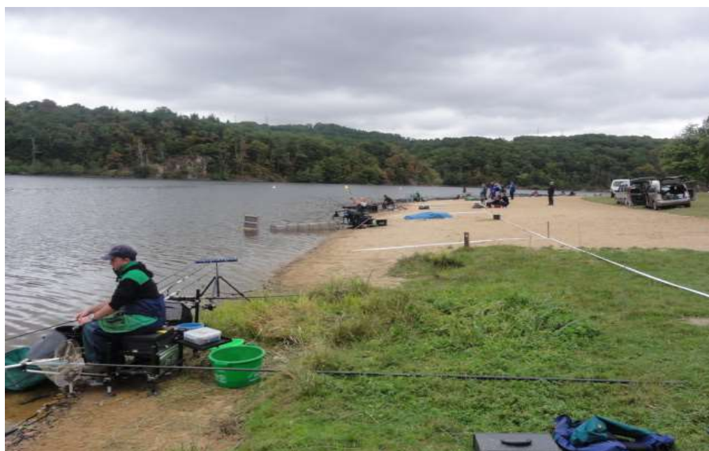
ANZEME SECTEUR PLAGE (10/15 places)