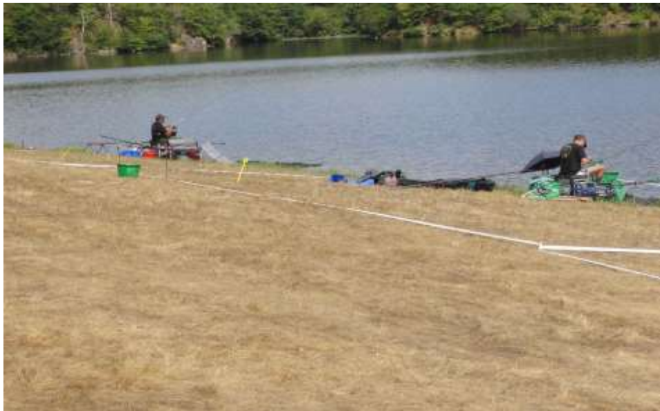
ANZEME SECTEUR PRE/BOIS (10/15 places)