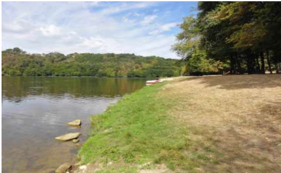
SECTEUR BOURG D'HEM (10/15 places)